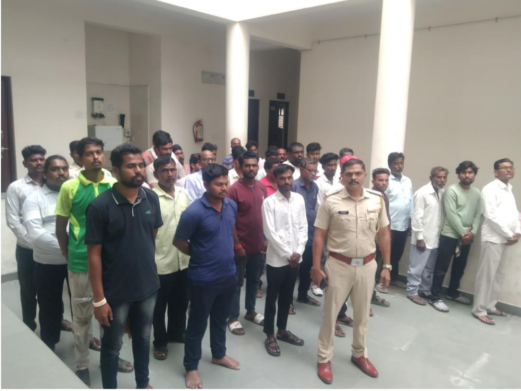
मा. पोलीस अधिक्षक नागपूर जिल्हा (ग्रामीण), नागपूर यांच्या मान्यतेने