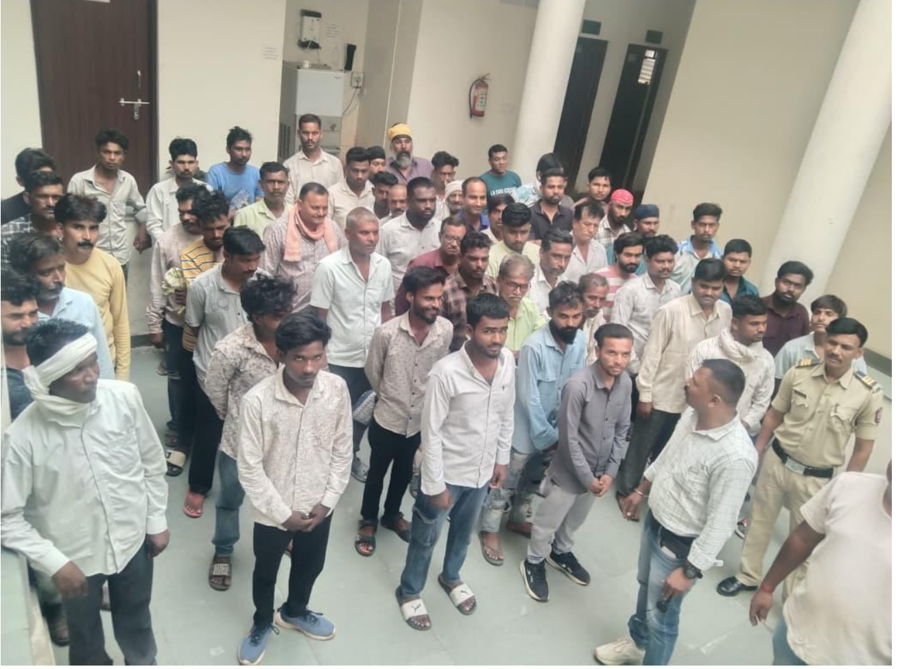
मा. पोलीस अधिक्षक नागपूर जिल्हा (ग्रामीण), नागपूर यांच्या मान्यतेने