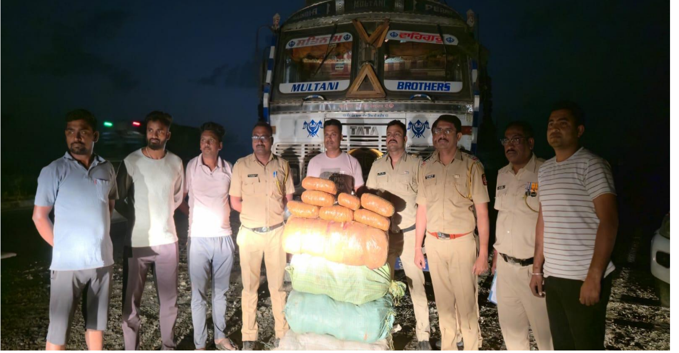
कारवाई करणारे पोलीस पथक जप्त मुद्देमालासह

नागपूर ग्रामीण पोलिसांनी अवैधरित्या रेतीची टोळीने चोरटी वाहतुक करून शासनाचा महसुल बुडवून फसवणुक करणाऱ्या ९ आरोपीतांच्या टोळी विरुद्ध महाराष्ट्र संघटीत गुन्हेगारी नियंत्रण अधिनियम सन १९९९ (MCOCA) अन्वये कारवाई केली आहे.